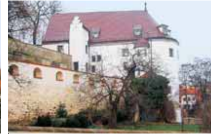
Torhaus des Altenburger Schlosses