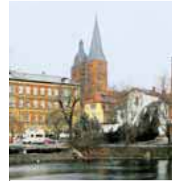
Die »Roten Spitzen«