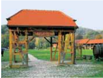
Thüringer Weintor in Bad Sulza