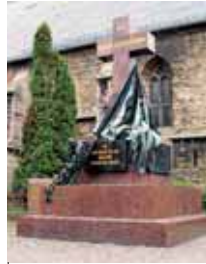
Kriegerdenkmal in Vierzehnheiligen