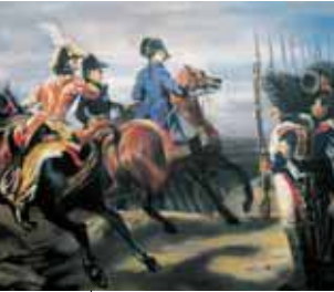
Schlachtdarstellung an einem Haus in Lützenroda

Jena – Cospeda – Closewitz – Apolda – Wickerstedt – Eberstedt – Bad Sulza – Großheringen