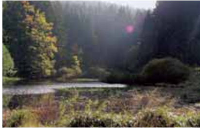
Der Dreisbach-Teich bei Suhl