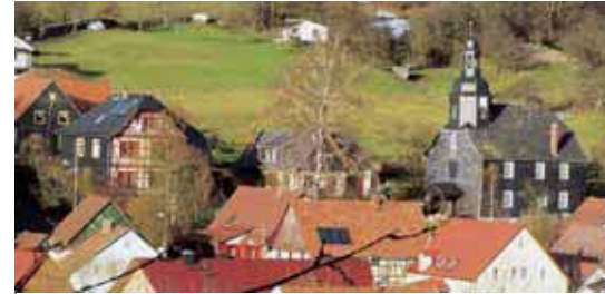
Blick auf Bischofrod