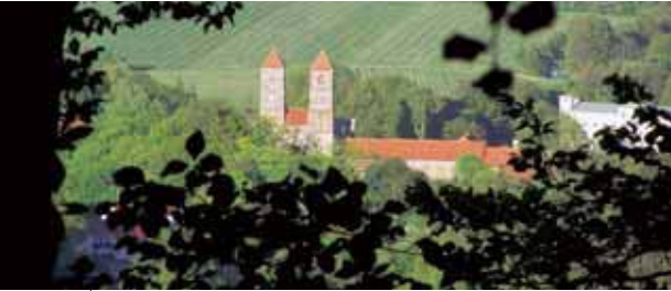
Blick auf das Kloster Veßra