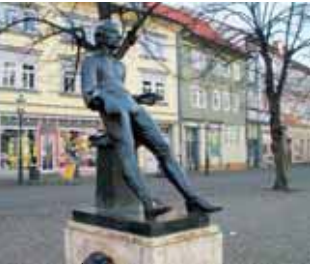
Bachdenkmal in Arnstadt

Erfurt-Bischleben – Apfelstädt – Holzhausen – Wachsenburg – Arnstadt – Molsdorf – Erfurt-Bischleben