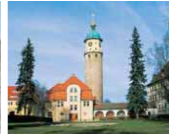
Schloss Neideck in Arnstadt