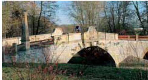
Historische Brücke in Ingersleben