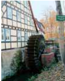
Wasserrad in Ingersleben