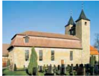
Kirche in Ottenhausen sowie Grabmal an dieser Kirchenmauer