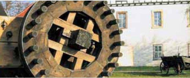
Runneburg – Spannrad der Steinschleuder